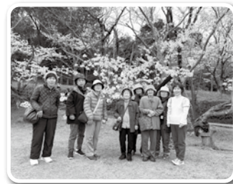
下ノ岡カフェ 平草原 お花見

私の家の近くでもカフェしたいなあ～！！ そんな思いのある方大歓迎です！ お気軽にご相談ください