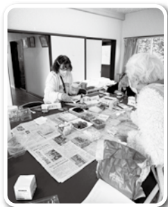
稲葉根カフェ 苔テラリウム作り