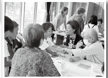
休憩時間に子ども達が 集まって来ます。

「地域の子も達と地域住民との交流の機会を増やしたい！」 市ノ瀬小学校内の施設を活用し月1回のペースでカフェを行っていま す。多世代交流を行うことにより、普段から声をかけやすい存在となり、 お互いが見守り、見守られる存在となり地域共生社会実現に向けて取り 組んでいます。