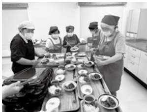
お料理のベテランスタッフ